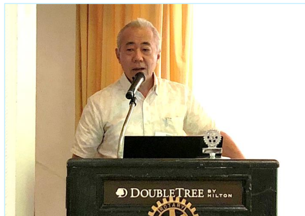
「クリーンビーチから考える環境問題」