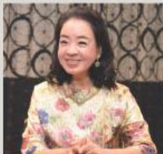
作詞家、プロデューサー 阿木 耀子氏 (あき・ようこ)