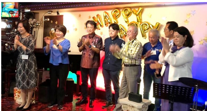
浦添RC参加者自己紹介♪