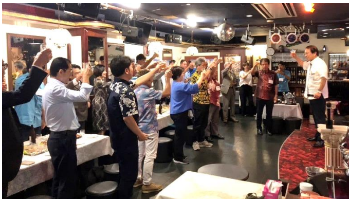
緑間ガバナー補佐 乾杯の音頭