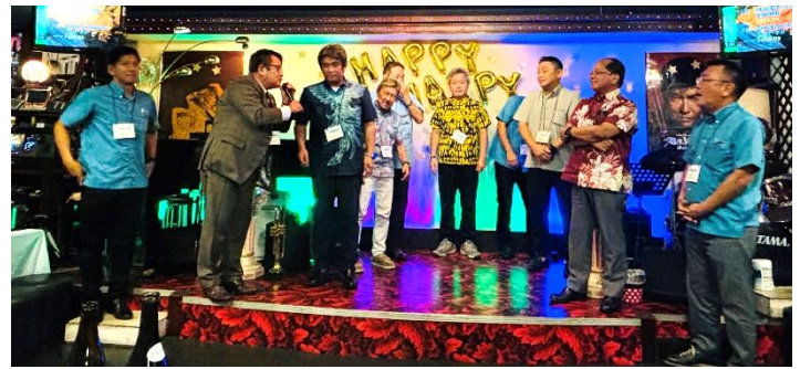
石垣RC参加者自己紹介♪