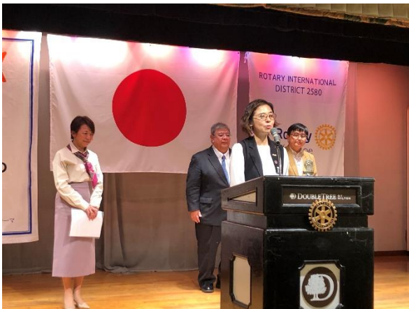
ホストクラブ:那覇東RCの皆様