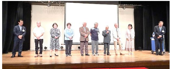
クラブ・自己紹介