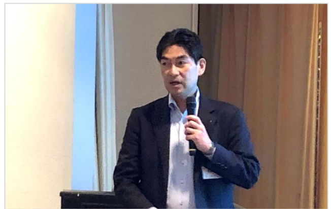
「沖縄ヤクルトの概況について」