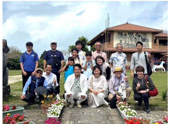
翌 26 日は石垣RCの皆さんのご案内で石垣観光へ