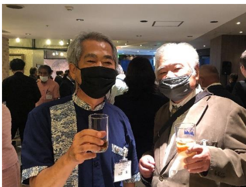
コザRC創立 60 周年式典にて