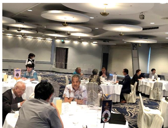
各テーブルにて意見交換