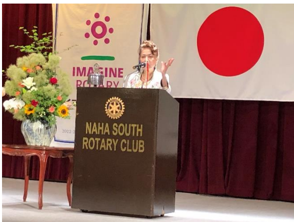
新城ガバナー補佐職務代行 ご挨拶