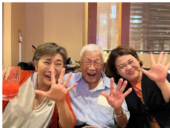
大変賑やかな親睦例会となりました！