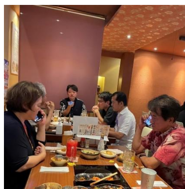
LINEビデオ通話 で「会長挨拶」