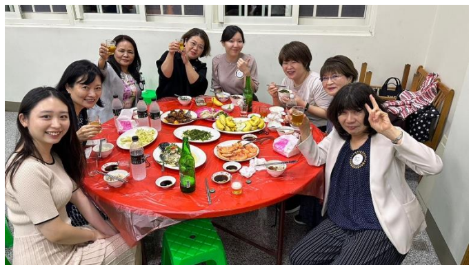
蘇澳RCの皆様が熱烈大歓迎下さいました。