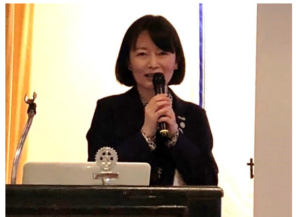
「ロータリー月間『水と衛生』」